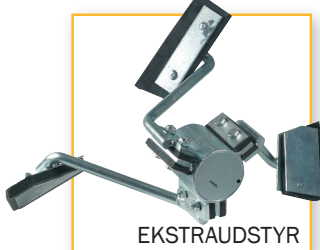
Blandearme, komplet m/gummiskovle Varenr. 120 020 DB-nr. 5104739