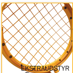
Dust Controller (Støvliminator) Varenr. 120 001DL DB-nr. 1405988