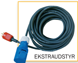
CE kabel, 10 M, DK stik Varenr. 1160 DB-nr. 5223314