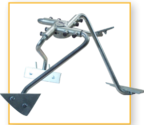
Blandearme, komplet m/stålskovle Varenr. 120 023 DB-nr. 5095141