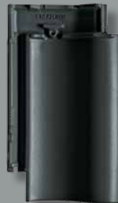
SKIFERSORT ENGOBERET Glansværdi 2