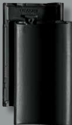
ANTRACIT ÆDELENGOBERET Glansværdi 8