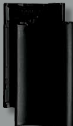
SORT ENGOBERET Glansværdi 33