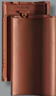
KOBERRØD ENGOBERET. Glansværdi 5