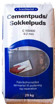
Scan Cementpuds/Sokkelpuds 20 kg DB-nr: 1973678