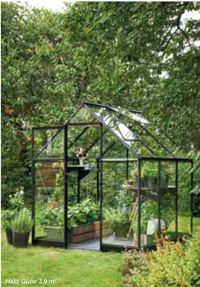
Halls Qube 3,9 m 2