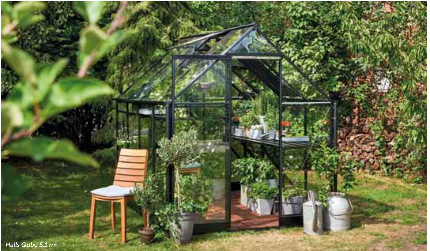
Halls Qube 5,1 m 2