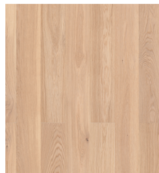
Eg Prime børstet Varenr.: 145070s DB nr.: 2307348