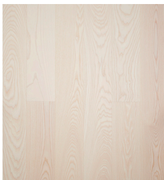
Ask Prime børstet Varenr.: 145029s DB nr.: 2307336