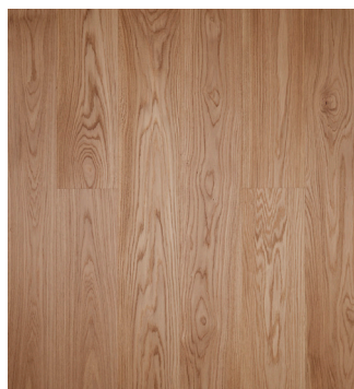
Eg Prime børstet Varenr.: 145058s DB nr.: 2307347