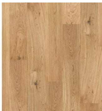
Eg Accent børstet Varenr.: 145023s DB nr.: 2307333