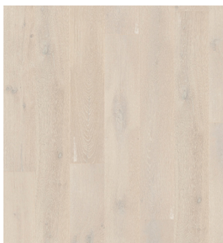
Eg Accent børstet Varenr.: 145022s DB nr.: 2307330