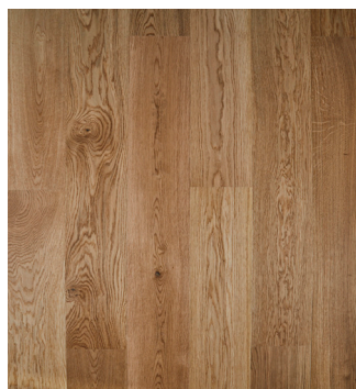
Eg Accent børstet Varenr.: 145033s DB nr.: 2307342