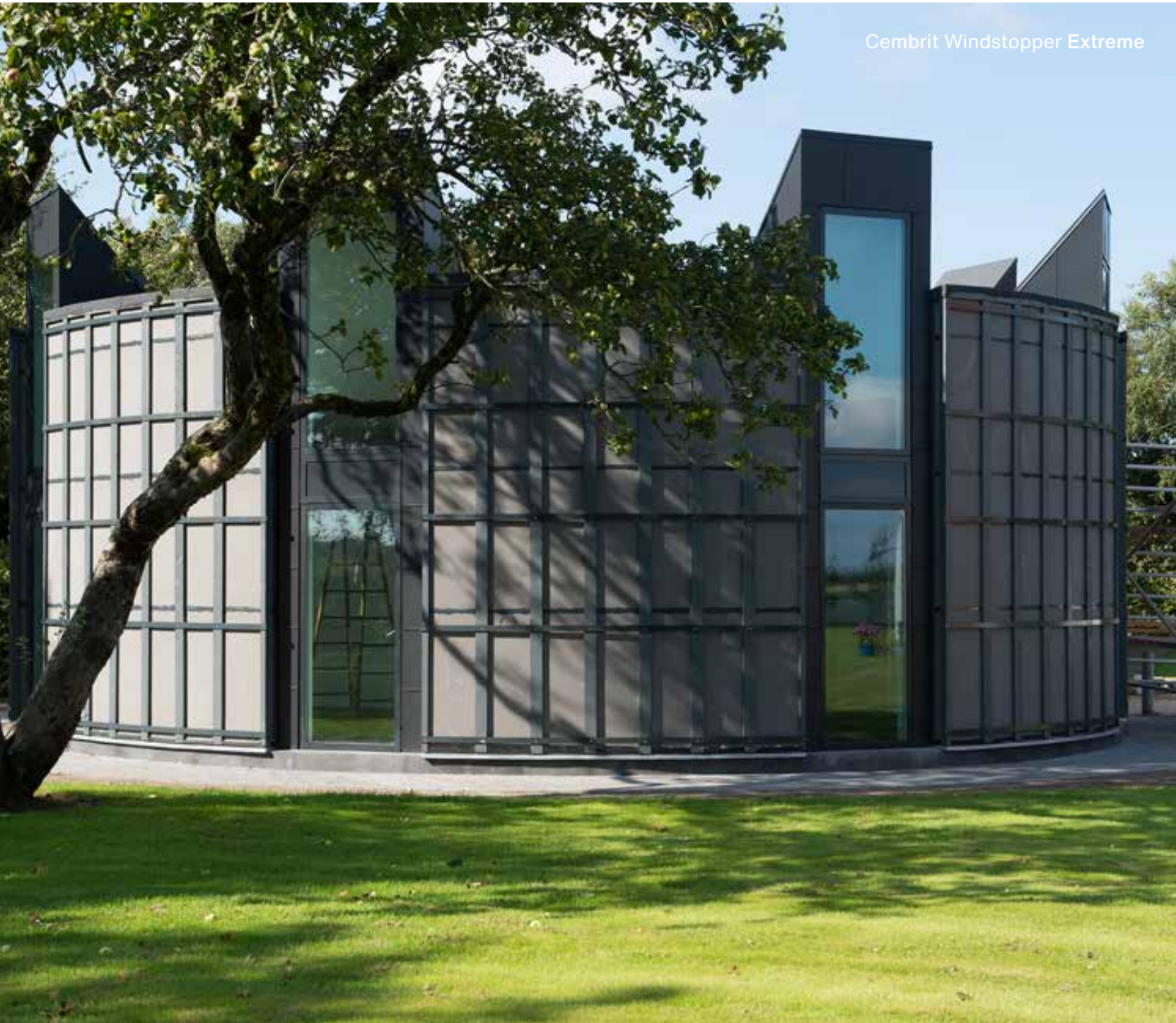
Cembrit Windstopper Extreme