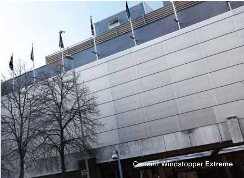
Cembrit Windstopper Extreme