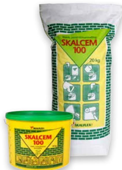
Skalcem 100 20 kg Hvid, DB-nr. 3859592

10 kg Hvid, DB-nr. 3859634 10 kg Grå, DB-nr. 8523003 10 kg Gråbeige, DB-nr. 2108820 10 kg Støvgrå, DB-nr. 2108819 10 kg Mellemgul, DB-nr. 8347932 10 kg Sølvgrå, DB-nr. 3859659 10 kg Røddokker, DB-nr. 5622217 10 kg Skagengul, DB-nr. 3859642 10 kg Creme, DB-nr. 4170874