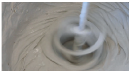
2 Mix Skamol Smooth Plaster med vand efter det angivne blandingsforhold.