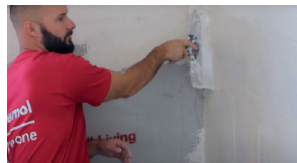
3 Påfør Skamol Smooth Plaster i en jævn tykkelse på 1,5 til 3mm.