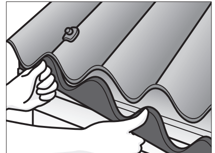
Bring plast bølgeklodser på plads, og rens tilstoppede ventilationsåbninger/hætter.