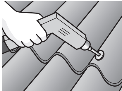
Fastgør løse skruer.