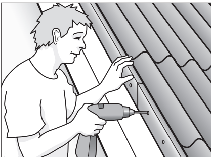
Fastgør løse inddækninger.