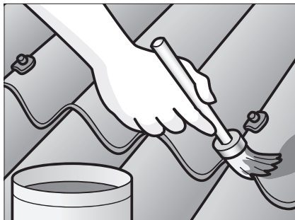
Pletmal småskader i farvelaget.