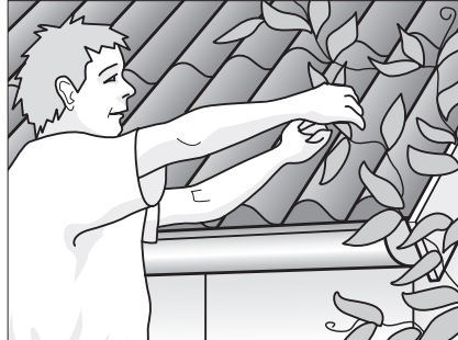
Fjern vildtvoksende planter fra tagrender og tag.