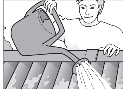
Fjern mos- og algevækst og overbrus med et middel mod grønne belægninger.