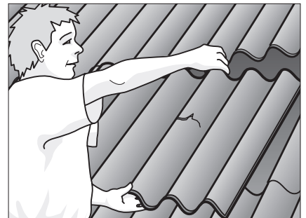
Udskift knækkede eller revnede plader.