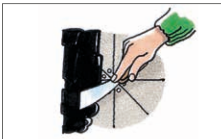
Flige trykkes tilbage, og der sømmes i spidser.