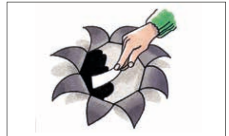
Underlaget skal være helt tørt, før der påføres Icopal Tagkit.