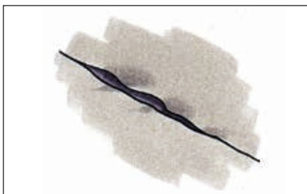
Revner sømmes til, og der påføres Tagkit og væv som under buler.