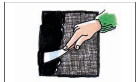
Der påføres to lag Tagkit. I det første, våde lag lægges et stykke væv, hvorefter sidste lag påføres.